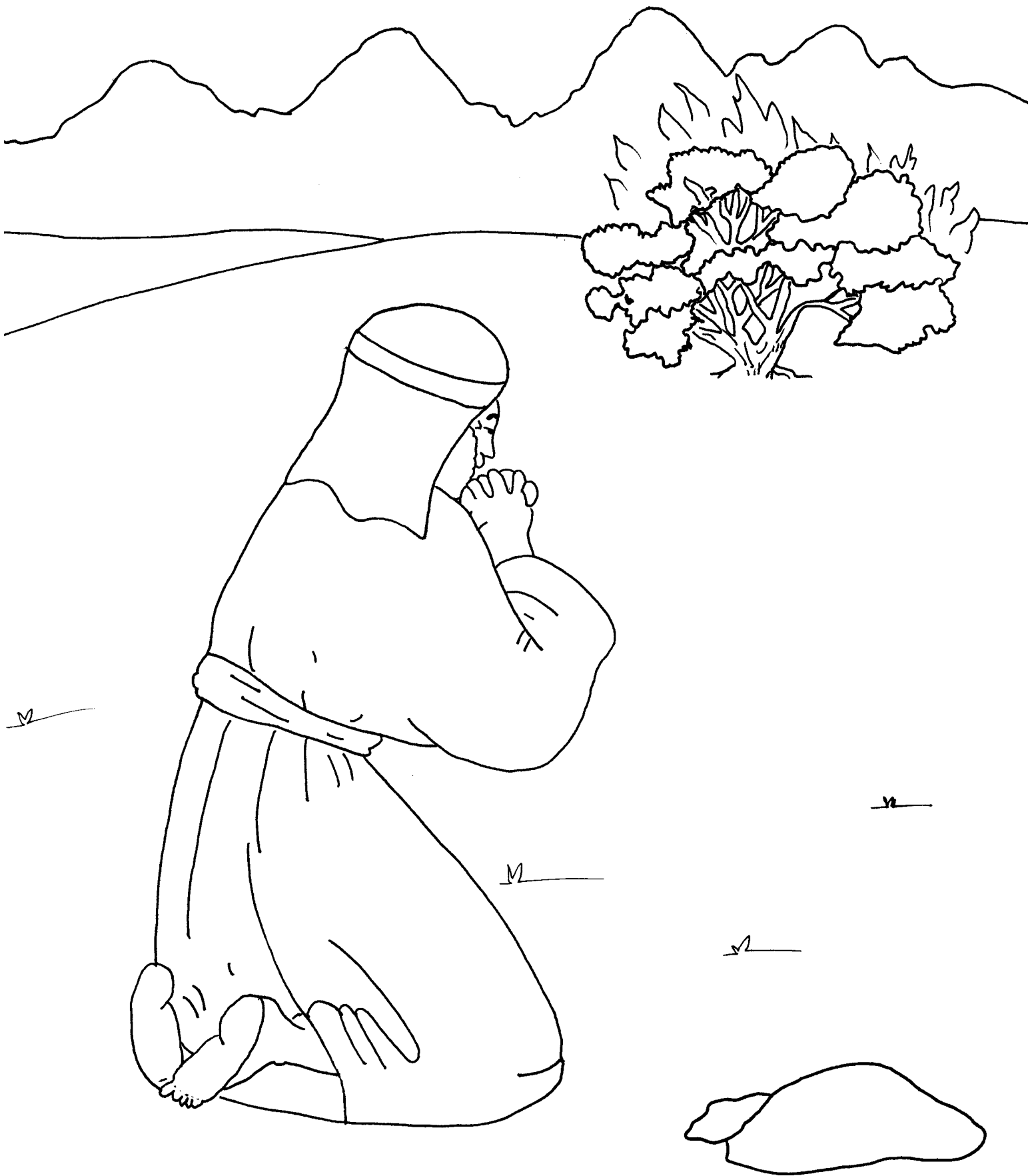
Moisés escucha a Dios