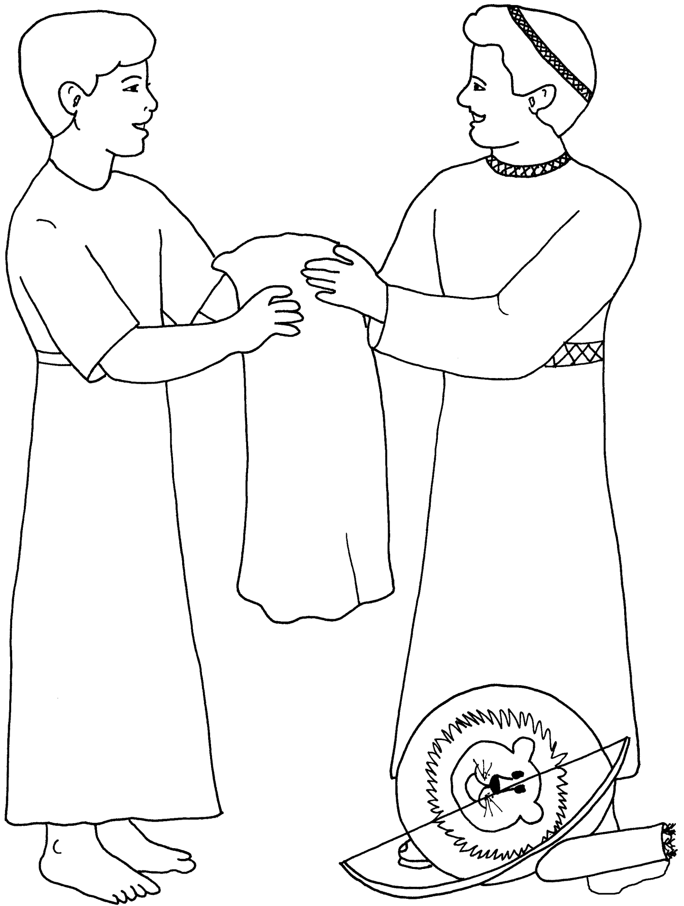
Jonatán hizo un pacto con David y le dio regalos